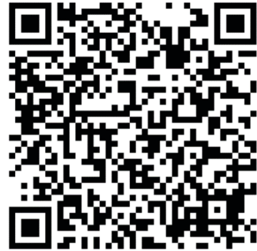
Ven Espíritu Divino - Partitura